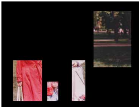
Felleskassen, Å være, å gjøre / To be, to do (2015)