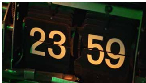
© Jeppe Rohde Nielsen, Game (2015)