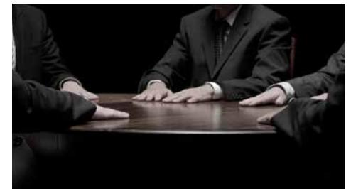
👁️ Søren Thilo Funder, The Vanishing Table (2014)