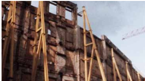
🕒 Eva la Cour, Composite/De-Composite (2015)