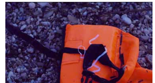
👁️ Other Story, Jan (2015)