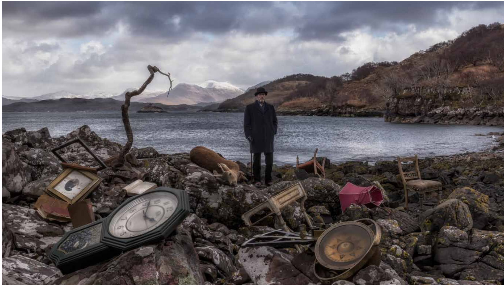
John Akomfrah, Vertigo Sea (2015). Still.