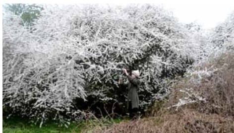
© Linea Ojala, Hvid Busk (2015)