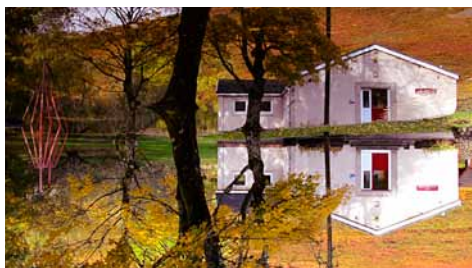
👁️ Lin Li, Fragments of Peace (2014)

Torsdag d. 3. marts kl. 19 kåres tre værker som vindere af dette års open call, hvorefter de tre vinderværker vises på en storskærm i udstillingen.