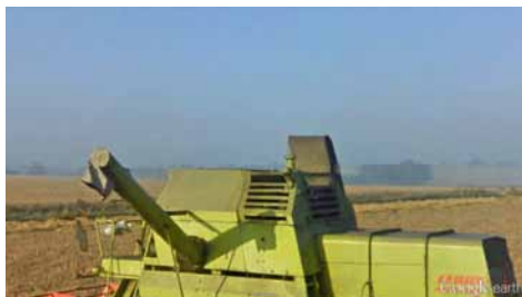
🕒 Luise Sejerssen, Mapping affiliations (2015)