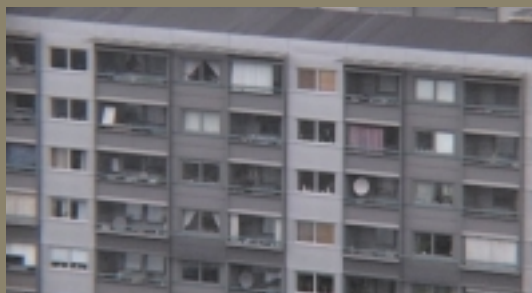
Still fra videoen Kvartermesteren, 2003 © Tina Enghoff