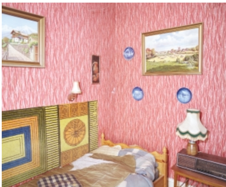
Mand født 1923, afgang ved døden på bopælen. Findedag den 12. juni 2003