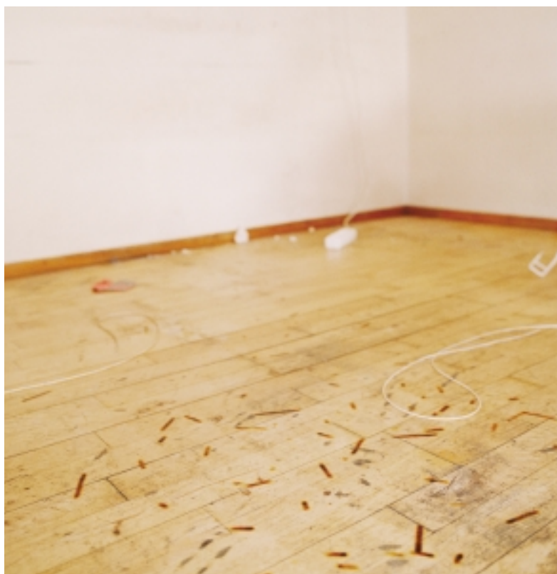
Mand født 1953, afgang ved døden på Amager Hospital den 13. december 2002