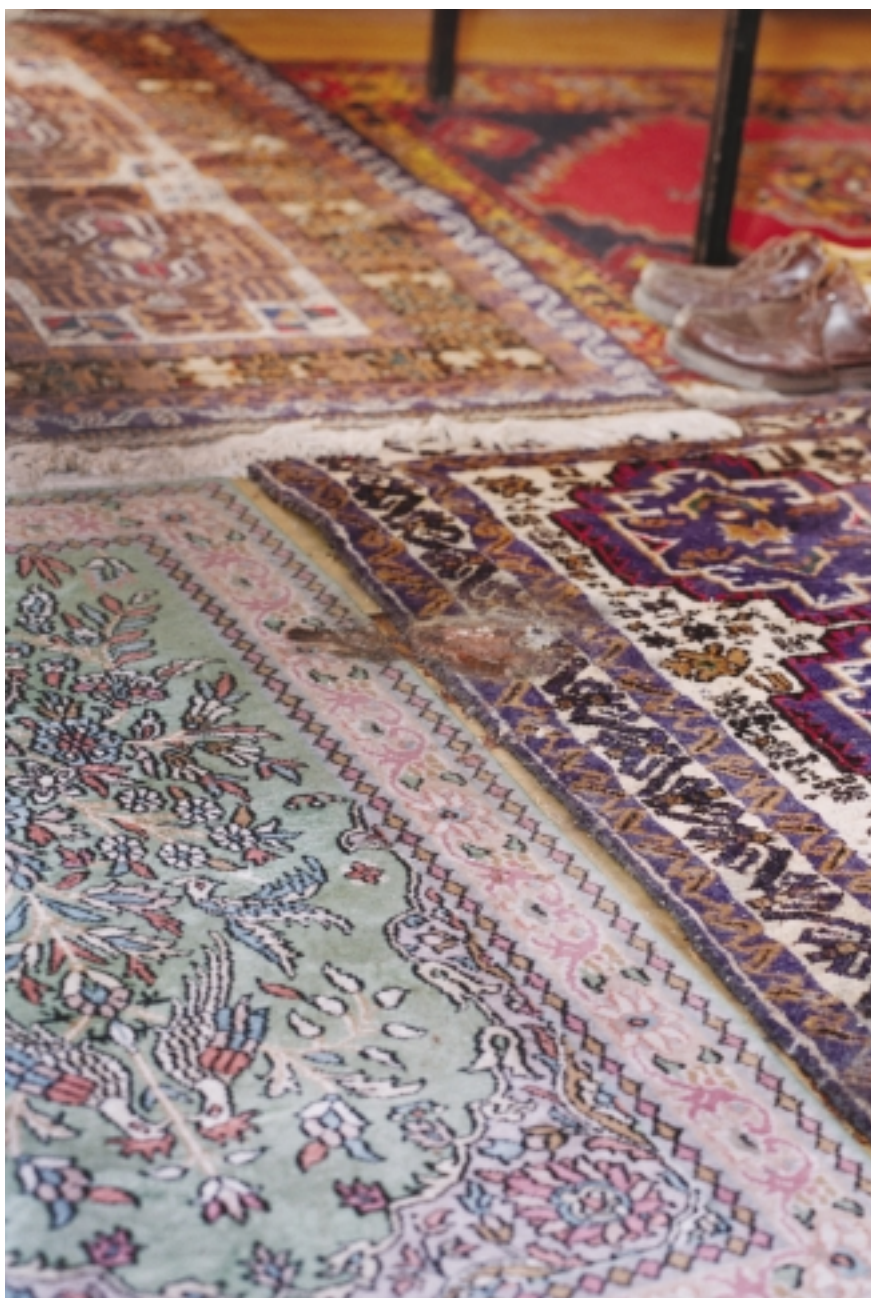
Mand født 1946, afgang ved døden på bopælen. Findedag den 17. marts 2003