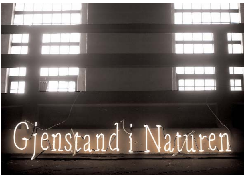
Installationsview fra Joseph Kosuths Genkendelige forskelle i Nikolaj Udstillingsbygning.

kom til at præge kunstscenen helt frem til i dag. For Kosuth er kunst grundlæggende en spørgende proces, der er til for at undersøge, hvordan betydning opstår i mødet mellem diverse sproglige og visuelle udtryk på den ene side og mennesker, steder og deres historie på den anden. Udsagnet kunst som idé som idé er blevet synonymt med Kosuths tænkning og kunstneriske praksis, hvor netop idéen eller konceptet er selve værket. Han henter elementerne i sine kunstværker fra alle mulige vidensområder – filosofi, videnskabelig teori, populærkultur, litteratur m.m. Kosuths omfattende produktion af værker og kunstteoretiske tekster udgør en samlet bestræbelse på at vise kompleksiteten i kulturens mange måder at generere og appropriere mening på – gennem sprog, gennem billeder, gennem objekter. Sprog og tekst er et hovedmedie i hans praksis. Kosuth betragtes som en af grundlæggerne bag konceptkunsten. Han bor og arbejder i New York og Rom.