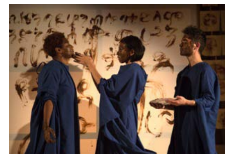
In the Beginning - Bemejemeria .

Skab din egen fortælling om, hvordan sproget er opstået. Du kan hente inspiration i performanceen In the Beginning - Bemejemeria , eller måske kender du til andre fortællinger og myter om sprogets oprindelse? Det kan også være, at du sidder inde med specialviden om sprogstammer, sprogets geografiske udbredelse mm.