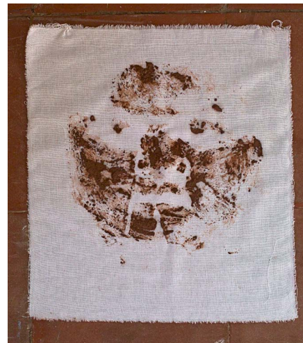
4. dag. Maskerade.