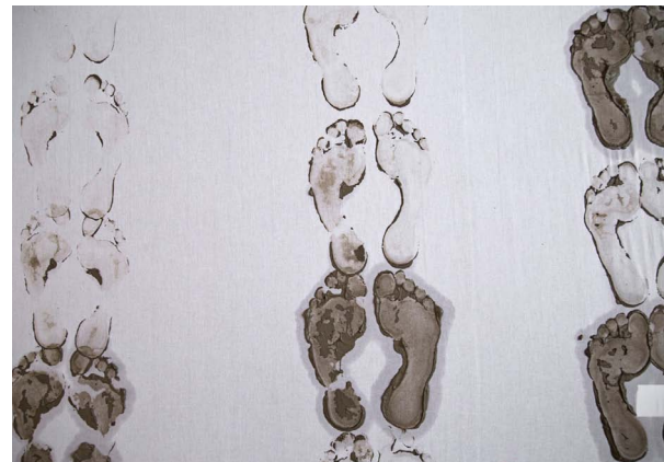
2. dag: Søkendespor.