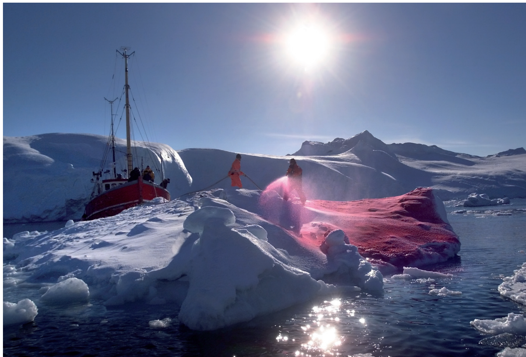
The Ice Cube Project 1, 2004, ©: Marco Evaristti

Beskuerens deltagelse er et nøgleord i forbindelse med Evaristti. Hans værker er interaktive, enten ved direkte at opfordre dig til at handle i forhold til værket, eller ved bevidst at bruge din reaktion som en del af værket.