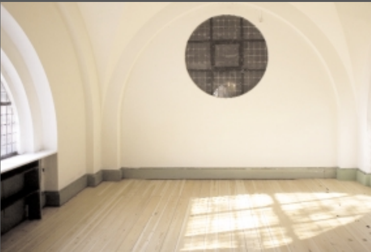
Foto af tomt kontorlokale i Nikolaj Udstillingsbygning

Vitalisere Levedegøre, at gøre livskraftig.