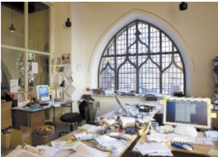
Foto af fyldt kontorlokale i Nikolaj Udstillingsbygning

Kunsthaller og museer er begge dele af den scene, som samtidskunsten lever af. Kunsthallerne beskæftiger sig udelukkende med skiftende udstillinger af den kunst, de synes er vigtigst og mest relevant i tiden ud fra individuelle kulturelle kontekster. Museerne er derimod karakteriseret ved deres samlinger af objekter (f.eks. kunstværker), som indgår i en tradition for videnskabelig kategorisering, forskning, fortolkning og formidling. Museerne viser også sideløbende særudstillinger, men er afhængige af en forholdsvis fast udstillingspolitik med faglig reference til samlingerne. Kunsthallernes friere organisering er derfor en væsentlig sikring af den platform, hvor den nyeste kunst, som enten ikke kan eller vil indordnes, eller blot endnu ikke har fundet vej til museernes samlinger, kan udfolde sig.