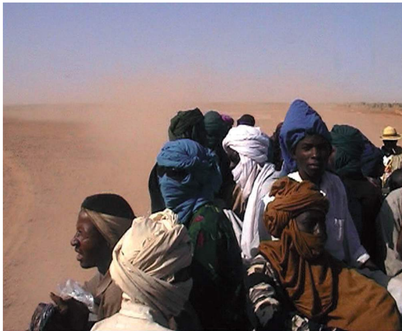
SAHARA CHRONICLE, 2006-2007

Indsamle i grupper på 3 forskellig officiel statistik og andet materiale (fx Danmarks Statistik, Velfærdsministeriet, Udenrigsministeriet og Udlændingsservice) om afrikanske indvandreres/flytninges ankomst til Danmark via Sahara gennem de seneste 10 år. Udvalgt og opsøg forskellige miljøer, hvor enkelte eller flere af netop disse afrikanere opholder sig eller bor i Danmark. Undersøg livsbetingelserne for en eller flere personer, og få om muligt lov til at lave et videointerview, hvor I optreder en personhistorie baglæns mod Sahara og evt. endnu længere ned i kontinentet. Rediger og samlet gruppernes materiale i et fælles videopræparat.