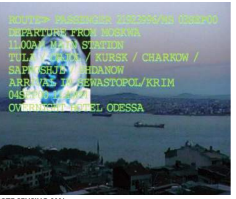
REMOTE SENSING, 2001