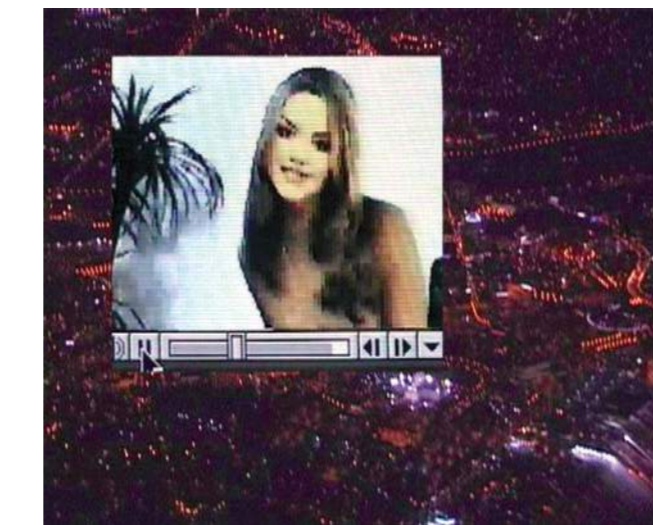
WRITING DESIRE, 2000

sexuelle ydelser bør hurtigst muligt kriminaliseres i Danmark”, "menneskehandel til sexindustrien er et globalt politisk ansvar", "det er kvinders natur at være begærsobjekt", "min kønsidentitet er påvirket af fordomme og tabuer", "Værdierne i klassen, harmonier eller forskelle, bliver tydelige for alle, når I bruger jeres krop og ikke stemmen til at udtrykke jer med. Find selv på flere udsagn med afsæt i de to værker Remote Sensing og Writing Desire. Diskuter evt. jeres standpunkter, "jeg står her, fordi ..." "