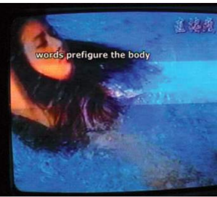
WRITING DESIRE, 2000

Definer et rum, hvor alle personligt skal forholde sig til følgende påstand/udsagn ved at placere sig på en imaginær værdilinie i lokalet, hvor 'enig' er den ene ende og 'uuenig' den anden: "Køb af seksuelle ydelser bør hurtigst muligt kriminaliseres i Danmark", "menneskehandel til sexindustrien er et globalt politisk ansvar", "det er kvinders natur at være begærsobjekt", "min kønsidentitet er påvirket af fordomme og tabuer", "Værdierne i klassen, harmonier eller forskelle, bliver tydelige for alle, når I bruger jeres krop og ikke stemmen til at udtrykke jer med. Find selv på flere udsagn med afsæt i de to værker Remote Sensing og Writing Desire. Diskuter evt. jeres standpunkter, "jeg står her, fordi ..." "