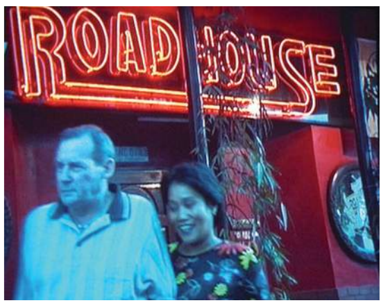
REMOTE SENSING, 2001

Værket zoomer ind på den globale sexhandel med kvinder, fra Manila til Nigeria, fra Burma til Thailand, fra Bulgarien til Vesteuropa. Den illegale transport af kvinder over grænser dokumenteres igennem flere visuelle niveauer: Fra satellitfotos, der registrerer og overvåger migrationer* verden over, til nærgående skildringer af nogle af de menneskeskæbner, der er direkte involveret i disse bevægelsesmønstre. Remote Sensing refererer i sin titel til det fænomen, at magtfulde instanser som eksempelvis stat og militær igennem objektive overvågningsbilleder taget med satellit på lang afstand af jorden kan kontrollere og følge migrationer* og grænsetrafik verden over – og dermed også udvekslingen af kvinder. Sammenstillingen af disse to visuelle repræsentationer indikerer, at denne geografiske, teknologiske overvågning er med til at fastholde den indbringende industri, der omgiver sexhandel og kvindeudvekslinger i dag. Biemann foretager ikke en moralsk distinktion mellem kvinder, der bliver handlet mod deres vilje, og kvinder, der vælger prostitution som en måde at overleve på, men udforsker den grænsezone for forhandlinger og udvekslinger, der udgør global sexhandel.