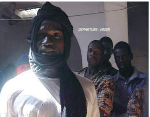
SAHARA CHRONICLE, 2006-2007