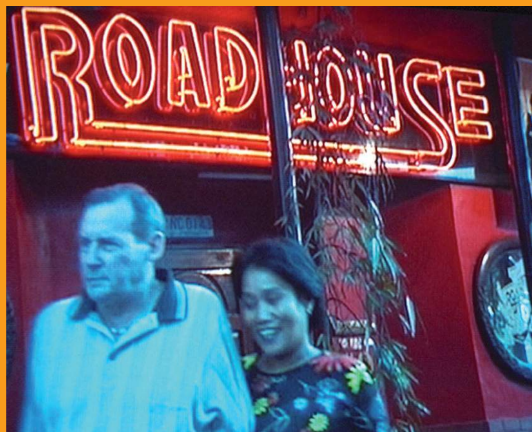
© Skoletjenesten / Kunsthallen Nikolaj 2009. Tekst og redaktion: Saja Brandt og Hilde Østergaard. Grafisk design: Marianne Biddehøj/Skoletjenesten, Tryk: Kalow Graphic. www.skoletjenesten.dk

Gymnasiet/HF, VUC, seminarier m.fl. Skoletjenesten / Kunsthallen Nikolaj