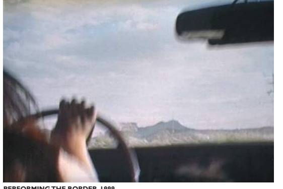
PERFORMING THE BORDER, 1999

Værket peger på de magtrelationer, der eksisterer mellem de to nationer, fokuserer i livet omkring de såkaldte maquiladoras*. I Juárez har især amerikanske industrier igennem de sidste 20 år på tværs af og på grund af grænsen skabt en særlig kønsbaseret og socialt, æstetisk og etisk diskutabel frihandelszone for millioner af kvindelige mexicanske arbejdere. Kvinderne tilbagelægger enten lange distancer fra fattige landområder eller bosætter sig med deres familier i selvbyggede slumhuse af materialer fra fabrikkerne for at tjene penge som samarbejdere i en af de mange maquiladoras, som husholdersker for overklassen eller nederst i hierarkiet: som prostituerede.