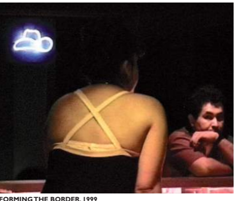
PERFORMING THE BORDER, 1999

For Biemann er især fenomenet grænser og alle de nutidige former for migration*, som grænser producerer, et hovedfokus i hendes kunst. Men et folks, en befolkningsgruppes eller enkeltindividets migration forudsætter mobilitet, som ofte er underlagt forskellige f.eks. kongelige og økonomiske magtforhold i de randområder af den vestlige scene, der beskæftiger Biemann.